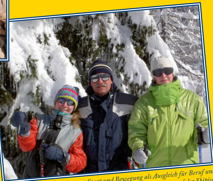
Sport und Bewegung als Ausgleich für Beruf und Gemeindearbeit – im Winter am liebsten auf der Skipiste