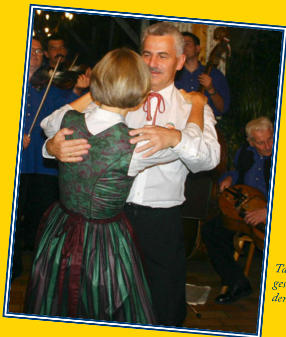
Tanzen als großes Hobby, nicht erst seit gestern – anfangs das Volkstanz, heute der Gesellschaftstanz