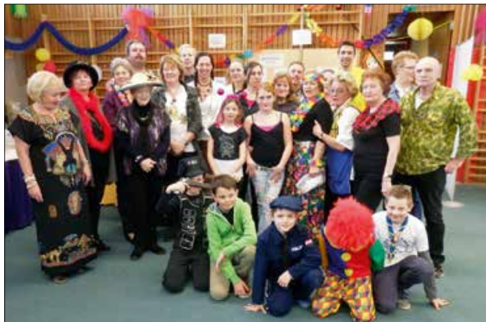
Nicht nur die Kinder haben sich verkleidet, auch das Organisationsteam

Wir alle freuen uns schon auf nächstes Jahr!